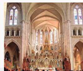
BASILICA DE LUJAN