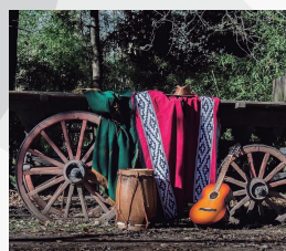
CHACRA "EL RANCHO"