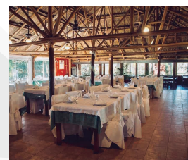
CHACRA "EL RANCHO"