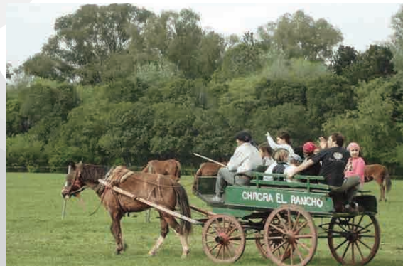
CHACRA "EL RANCHO"